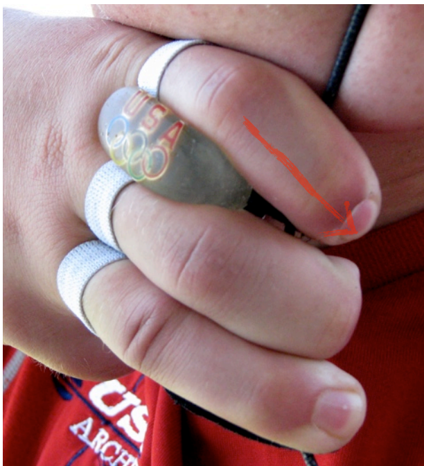
FALSCH – ABWÄRTSEINHAKEN